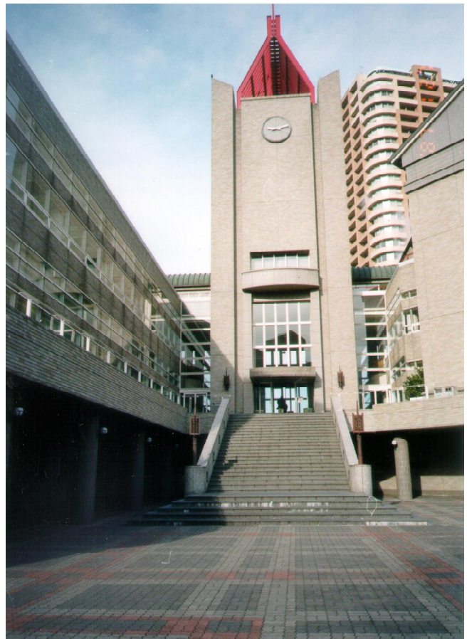
Фото 1. Главное здание Университета Васеда (Токио), где проходил I симпозиум по проекту 434.

подход поможет ученым проекта коррелировать деятельность плюма в мелу и связанных с ним тектонических движений в Восточной и Южной Азии на более высоком научном уровне и с большей достоверностью. Проект не только рассматривает проблемы корреляции, но и предусматривает установление