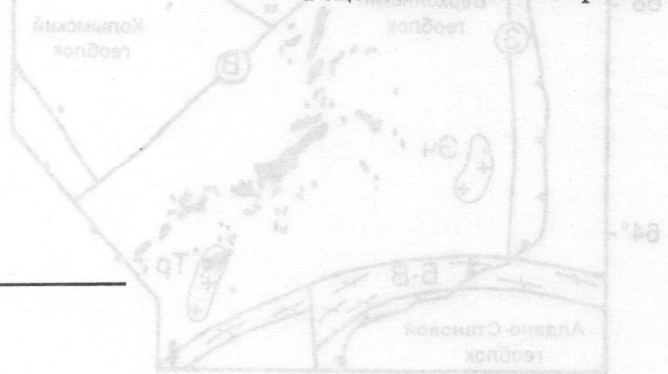
Рис. 1. Схема геологических структур в структуре кристаллического фундамента Восточно-Колымской ойрогенной области (1) — западная граница Восточно-Колымской ойрогенной области; 2 — граница Колымского купола; Кп — Колымский Тр.; Тр — Тарбагатайский Тр.; Харуэвская, ЭЭ — Эридикит; 3 — мезозойская трансформация; 4 — мезозойское разломное кристаллическое фундаментальное (В — Восточно-Колымский, З — Забайкальско-Валдайский (В-В) подорожниковый); 5 — Байкало-Валдайский (В-В) подорожниковый разломный пояс

Московский государственный геологоразведочный университет Рецензент — А.К. Корсаков