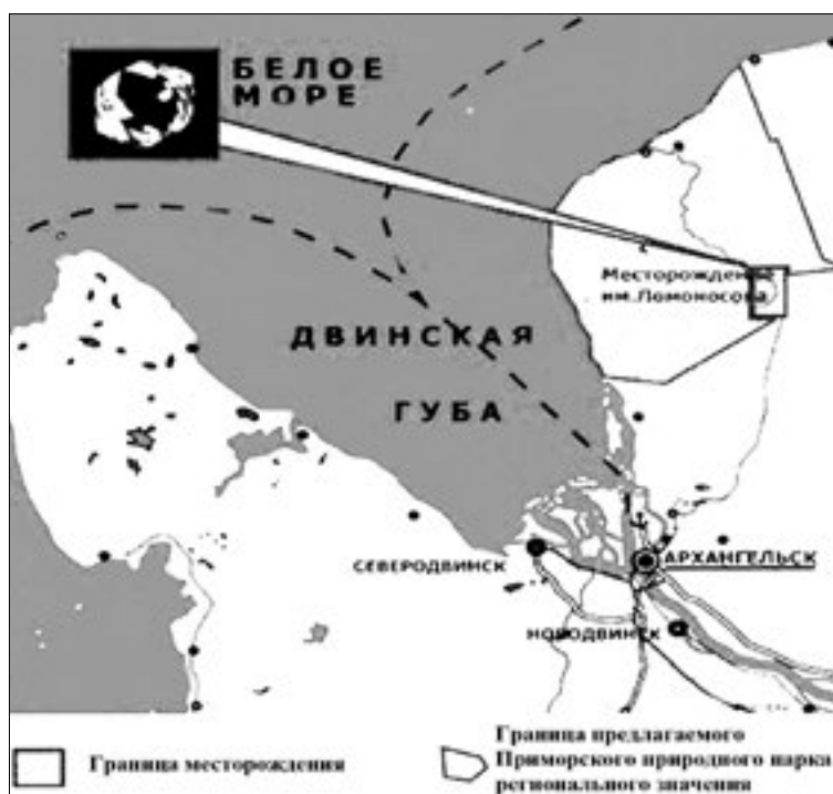
Рис. 1. Обзорная схема размещения месторождения имени Ломоносова

Краткая характеристика месторождения. Месторождение алмазов имени Ломоносова представлено 6 кимберлитовыми трубками: Архангельская, имени Карпинского-1, имени Карпинского-2, Пионерская, Поморская, имени Ломоносова.