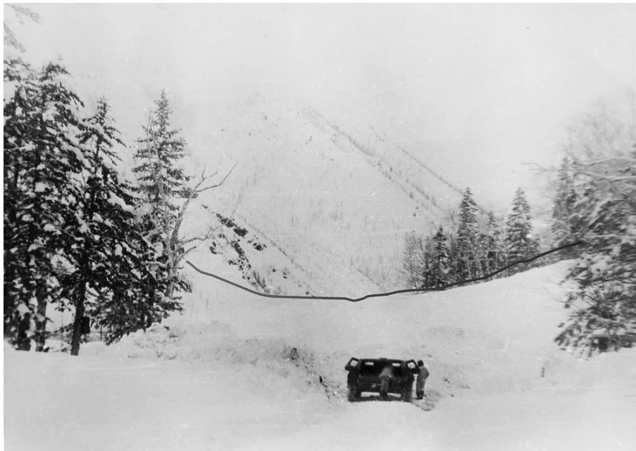
Рис. 3. Конус выноса лавины трансформации снежной толщи, сошедшей 05.05.92 г. (фото Окопного В.И.). Линией обозначена верхняя граница лавинных отложений.