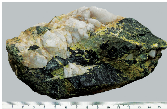
Рис. 2. Вольфрамит с тунгситом. № ГР-04168. Фонды ГГМ РАН, фото И.Л. Сороки

крывателю месторождения В.Н. Миляеву определить главные минералы в первый же день открытия месторождения. Первые образцы касситерита, взятые с поверхности, не всегда отличаются привлекательностью. Позднее Иультинское месторождение славилось красивыми, крупными коллекционными кристаллами касситерита, широко представленными во многих минералогических музеях мира и в частных коллекциях.