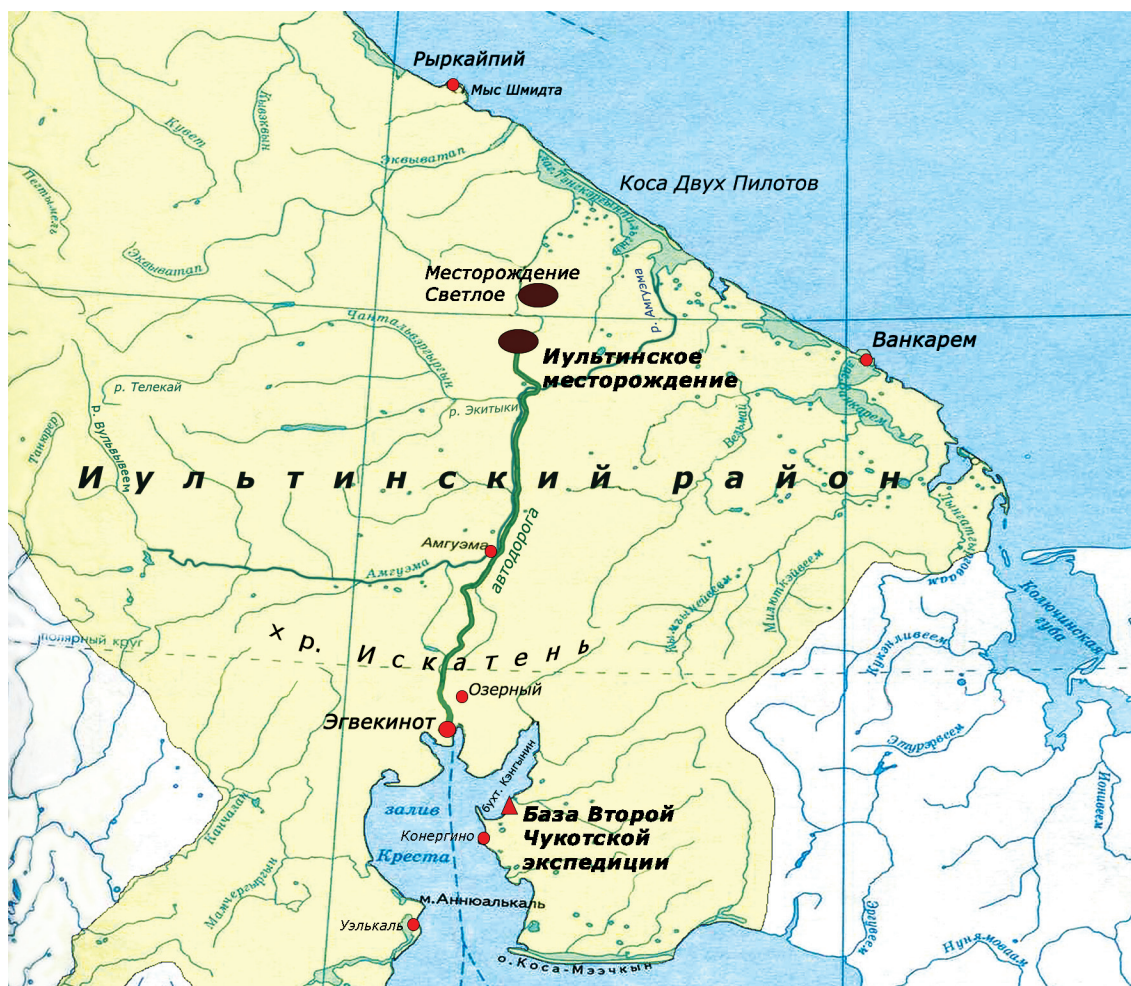
Рис. 3. Схематическая карта района работ Второй Чукотской экспедиции Главсевморпути.