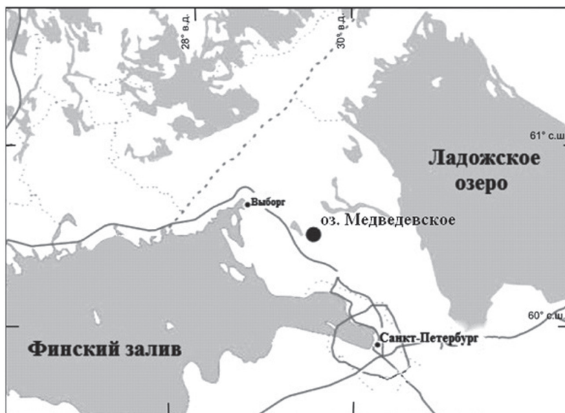
Рис. 1. Местонахождение озера Медведевского, Карельский перешеек

Объектом исследования выбрано озеро Медведевское, Карельский перешеек (60°14' с. ш., 29°54' в. д., 102,2 м н. у. м.). Это небольшое мелководное озеро: площадь зеркала воды составляет 0,44 км 2 , максимальная глубина – около 4 м (рис. 1). Оз. Медведевское расположено на Центральной возвышенности Карельского перешейка, в зоне распространения возвышенностей на валунных (моренных) суглинках и супесях. Берега отлогие, местами низкие, песчано-каменистые и суглинистые, покрыты лиственным лесом с примесью хвойных пород. Восточный и западный берега заболочены. Дно озера преимущественно песчано-каменистое, местами присутствуют заиленные участки. Вода светлая и прозрачная. Загрязнение озера незначительное. Зарастаемость – около 20 % площади. Летнего «цветения» воды практически нет [Субетто, 2009; Андроников и др., 2014].