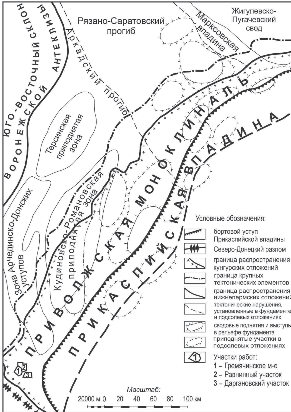
Рис. 1. Тектоническая схема северо-западного обрамления Прикаспийской впадины

непермской галогенной формации северного обрамления Прикаспийской впадины. В нем ритмопачки определяются как свиты, карбонатно-сульфатная толща выделяется в качестве карпенской серии, а в кровле соленосных образований выделена озерская свита. По мнению многих видных исследователей [11–17], в основу литологического принципа расчленения соленосных комплексов положена именно ритмостратиграфия: прослеживание определенных ритмопачек, отвечающих отдельным циклам прогрессивного засоления бассейнов, от стадии низкой солености до высокой. Кроме того,