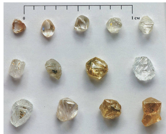
Рис. 1. Алмазы из кимберлитов трубки Таежная (Малоботубинский алмазоносный район)

Во второй группе отмечается (рис. 1) примерно равное соотношение кристаллов октаэдрического и ромбододекаэдрического габитусов при сравнительно низком (первые проценты) содержании