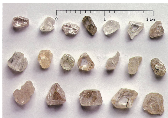
Рис. 3. Алмазы из кимберлитов трубки Нюрбинская (Средне-Мархинский алмазоносный район)

морфных особенностей, присущих богатым диатремам (рис. 3), с преобладанием кристаллов октаэдрического (О), переходного (ОД) и ромбододекаэдрического (Д) (их соотношением О:ОД:Д=1:1:1) габитусов, при отсутствии типичных округлых алмазов, и заметным (до 5%) содержанием кристаллов псевдоромбододекаэдрического габитуса, сложенных тригональными слоями роста «мархинского» типа. Кимберлитовые диатремы этого поля характеризуются также присутствием в небольшом (около 5%) количестве алмазов с тонкой окрашенной оболочкой 1V разновидности и низким содержанием двойников и сростков, превалированием индивидов с розово-сиреневой фотолюминесценцией, с высоким содержанием примесного азота в форме А-центра. Большинство встреченных сингенетических включений представлены минералами-узниками ультраосновной ассоциации.