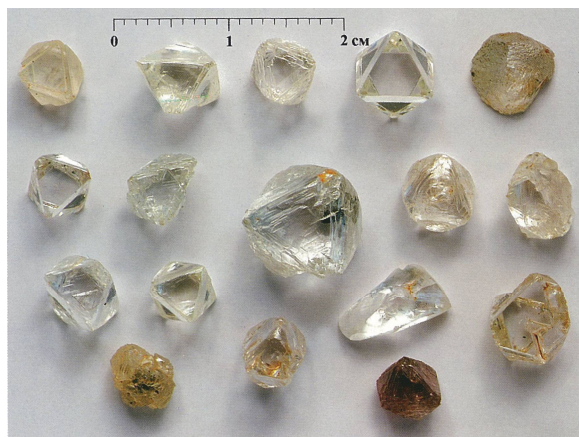
Рис. 2. Алмазы из кимберлитов трубки Мир (Малоботубинский алмазоносный район)

Третья , наиболее высокопродуктивная группа кимберлитовых тел характеризуется преобладанием груболаминарных кристаллов октаэдрического (рис. 2) и переходного от него к ромбододекаэдрическому габитусов при низком (менее 10%) содержании индивидов ромбододекаэдрического габитуса, среди которых практически отсутствуют типичные округлые алмазы.