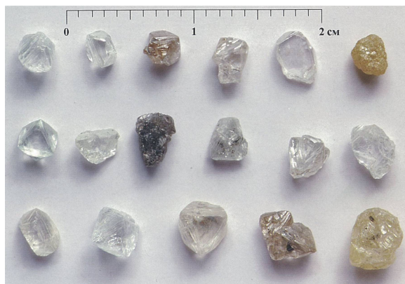
Рис. 4. Алмазы из кимберлитов трубки Айхал (Далдыно-Алакитский алмазоносный район)

более 50%). Следует отметить, что каждая из этих трубок индивидуальна по типоморфным особенностям алмазов. Из других черт следует выделить высокое содержание двойников и сростков, а также поликристаллических агрегатов, преобладание кристаллов с сине-голубой, реже с зеленой фотолюминесценцией.