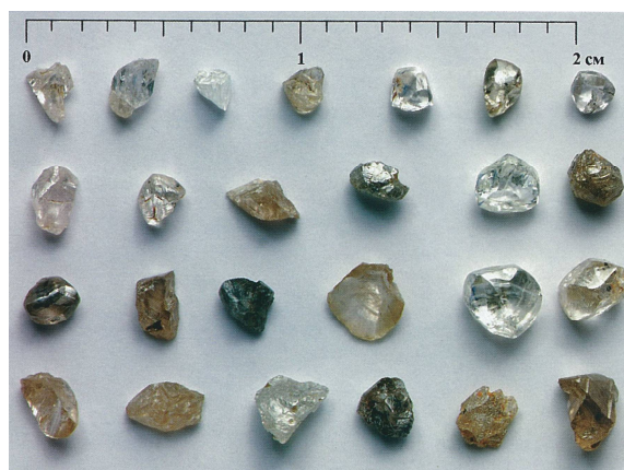
Рис. 5. Алмазы из кимберлитов трубки Заполярная (Верхнемунское поле)

Алмазы из кимберлитовых тел Верхнемунского поля по своим типоморфным особенностям занимают обособленное положение в пределах рассматриваемой субпровинции. Они характеризуются морфологическим спектром кристаллов с преобладанием додекаэдроидов с шагренью и полосами пластической деформации, которые присутствуют в кимберлитовых телах с убогой алмазоносностью. Это находится в противоречии с их сравнительно высокой (полупромышленной) алмазоносностью, достигающей в некоторых трубках (Заполярная) промышленных концентраций (рис. 5), т.е., с одной сторо-