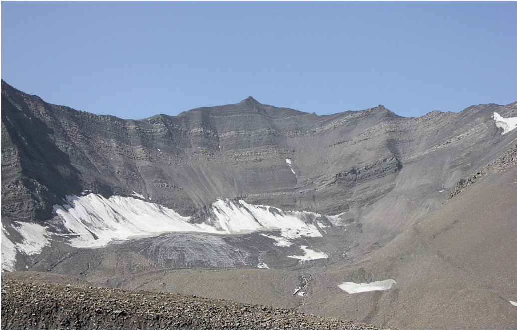
Рис. 1. Кар на северо-восточном склоне г. Балиал (4007 м).

ледниковые формы рельефа можно увидеть на хребте Дюльтыдаг, например кар на восточном склоне г. Балиал (рис. 1).