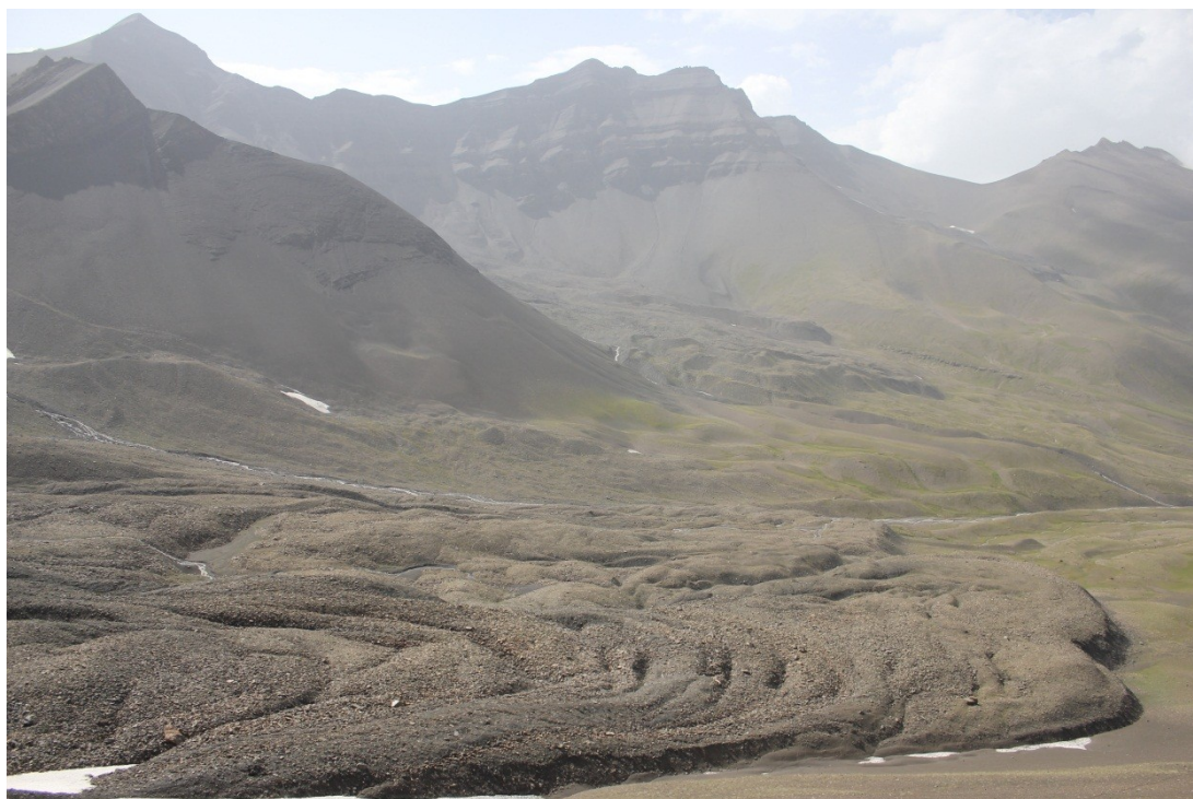
Рис. 3. Морены в цирке на северо-восточном склоне хр. Дюльтыдаг.

никовые формы рельефа в Дагестане в силу специфики климата и горных пород распространены крайне слабо, однако, в последние годы появляются данные о более широком развитии ледниковых форм в Дагестане [4]. При этом предполагается, что возраст таких морен не превышает нескольких сотен лет. Согласно нашим данным, в благоприятных условиях, морены в регионе распространены относительно широко (рис. 3). В составе основных морен в горах преобладает абляционная морена, образующаяся при вытаявании. Для основной морены характерен беспорядочный холмисто-западинный рельеф, на фоне которого выделяются продольные гряды боковых и срединных морен. Несмотря на размеры обломочного материала, характер движения ледников хорошо прослеживается при их рассмотрении даже с небольшой высоты. Границы между карами и цирками образуют зазубренный водораздельный гребень.