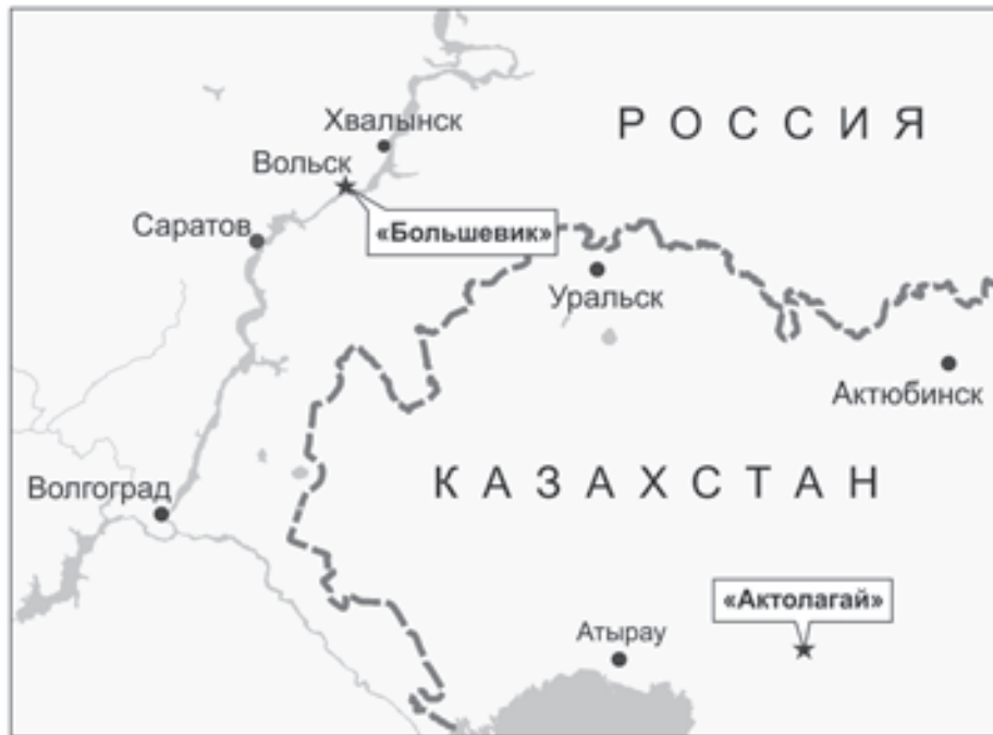
Рис. 1. Схема расположения изученных разрезов

образцы с аномального петромагнитного уровня и соседних интервалов также были переданы на микрондзовые и геохимические исследования, результаты которых представлены в настоящей работе.