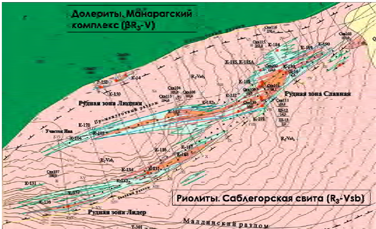
Рис.1. Схема расположения рудных зон месторождения