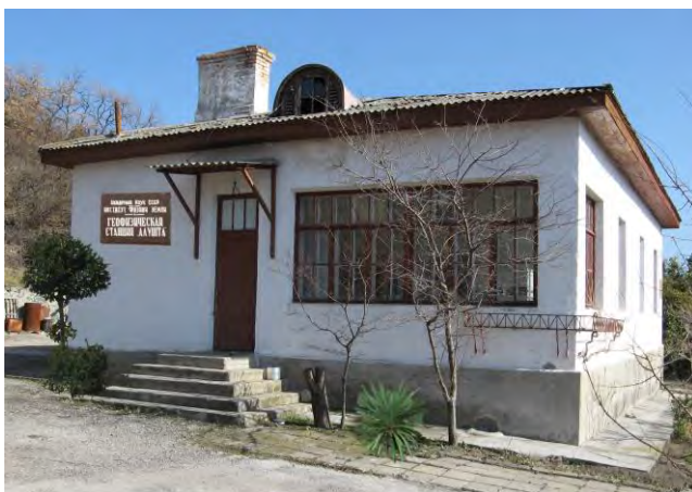
Рис. 1. Геофизическая станция «Алушта». Здание построено в 1957 г.

В 1959 г. вблизи станции (на расстоянии 90 м) проложили троллейбусную трассу Симферополь – Ялта, началось оживленное движение грузового и пассажирского транспорта, что создало целый ряд помех при регистрации сейсмических сигналов. Чтобы избежать помех, был построен выносной павильон в 200 м от станции на выходах скальных пород. В ноябре 1961 г. сейсмографы СХ были перенесены в этот павильон. Но в 2004 г. выносной павильон с сейсмометрами был разрушен грабителями. Чудом уцелевшую аппаратуру пришлось установить в подвале сейсмической станции, в результате чего возрос уровень помех от проходящего по трассе транспорта.