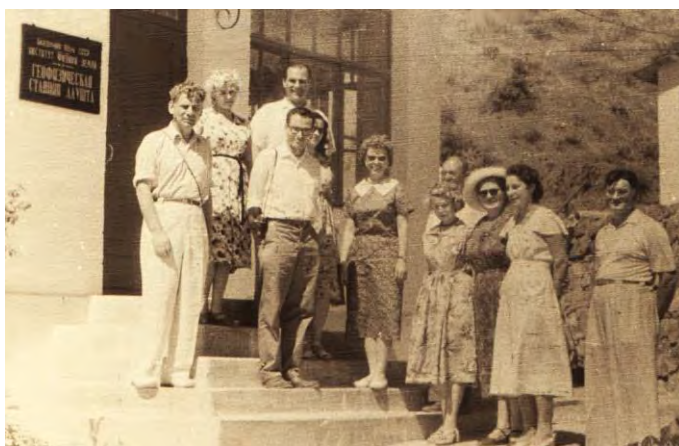
Рис. 5. Посещение геофизической станции «Алушта» известным американским сейсмологом Франком Прессом (второй слева в первом ряду), 1960 г.

Северокавказскую сеть сейсмических станций с центральной станцией в Симферополе. Крымско-Северокавказская сеть занималась технической помощью станциям, методическими разработками, инспектированием и улучшением качества работы. Кроме того, на станциях проводились научно-методические семинары и совещания. Эти семинары, иногда проходившие на сейсмической станции «Алушта», часто посещали иностранные ученые (Рис. 5).