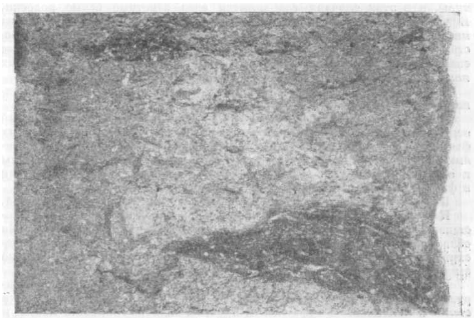
Рис. 2. Игнимбрит из средней части горизонта 1:1