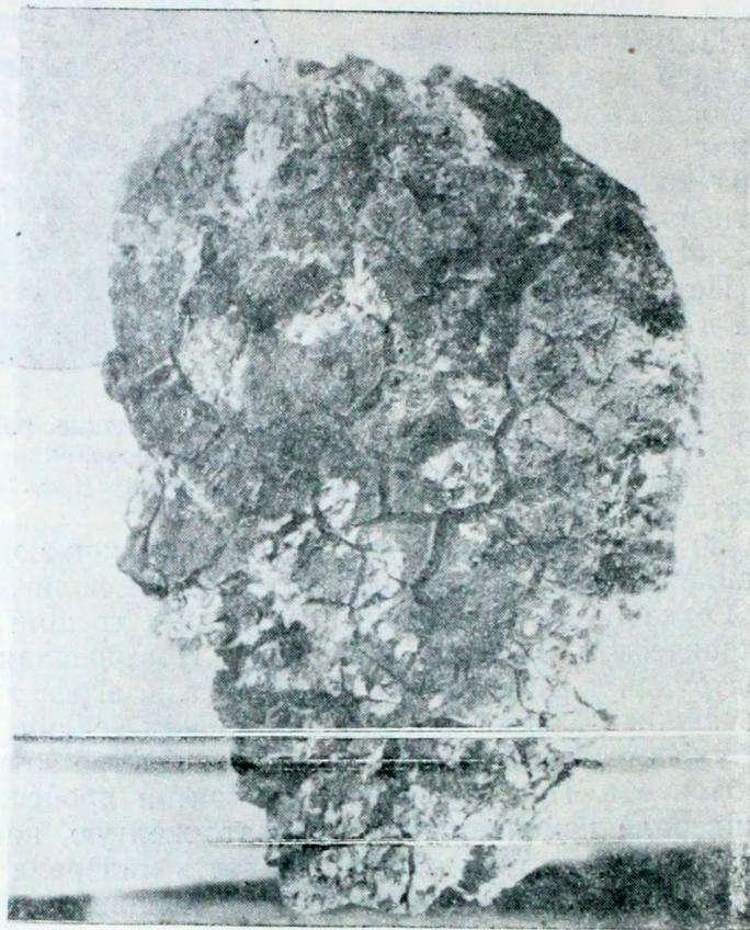
Рис. 2. Агрегат смоляниновита. Хорошо заметны трещины дегидратации. На поверхности агрегата видны розетки гипса (белые). Нат. величина.

Рентгенометрическое изучение минерала было выполнено в лаборатории Западно-Сибирского геологического управления под руководством Б. Г. Эренбурга. Съемка проводилась в камерах диаметром 57,3 мм, на железном излучении при напряжении около 30 кV и силе тока около 10 mA. Межплоскостные расстояния исправлены по отдельным снимкам смеси с бромистым аммонием.